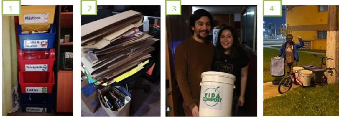
1) Punto limpio, 2) Recopilación de cartón, 3) contenedor de residuos orgánicos, 4) Retiro de residuos orgánicos

ANEXO C: Fotografías de puntos limpios o manera de recopilar residuos reciclables de una de las colaboradoras de Greening SpA.